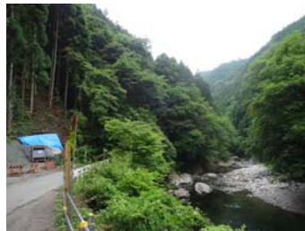
視察2-2：設楽ダム 付替道路工事現場等 【設楽町小松】国県道の付替道路(橋梁等)の工事現場等を見学します