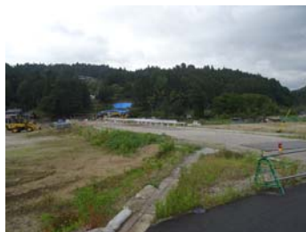
視察1：道の駅等建設現場、設楽町役場 【設楽町清崎、田口】設楽町役場や建設予定の道の駅・歴史民俗資料館等の建設現場を見学します。

今回、設楽ダム建設事業及び周辺整備事業について、設楽ダムの水資源を享受する東三河地域住民が理解を深め、住民一人一人が設楽ダムや設楽町を地域内外にPRする等、上流部の設楽町の地域活性化に繋げる活動に展開して頂くために、『設楽ダム建設見学観光ツアー』を開催することと致しました。是非皆様、ご参加下さいますようお願い申し上げます。なお、 お申し込みは、9月19日(火)までにFAX若しくはE-mailにて、ご連絡下さいますようお願い申し上げます。