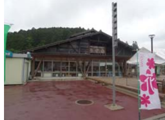
昼食：みのや旅館 【設楽町津具】設楽で採れた山菜や川魚など、旬な幸を頂きます。 休憩：アグリステーションなぐら 【設楽町名倉】地元の方々が愛情込めた野菜等をお買い求め頂きます。