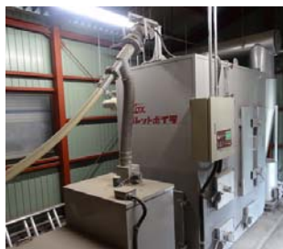
視察 2:湯〜らんどパルとよね【豊根村】

間伐材を製材して土木用材にしたり、残りの端材を使って木質ペレットを作る等、森林資源の有効活用を行っています。