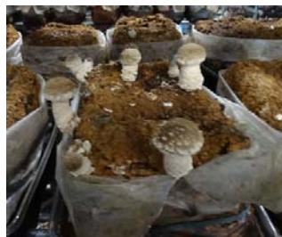
休憩:グリーンセンターしんしろ【新城市】、など

「グリーンセンターしんしろ」などの、産地直売施設で休憩を取ります。菌床しいたけなど買物物は自由にできます。