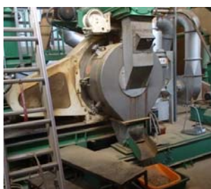
視察 1:とよね木サイクルセンター【豊根村】

そこで、今回、東三河地域住民が知っていそうであまり知らない奥三河の森林資源を活用した林業や農業の理解を深め、住民一人一人が奥三河の地場産品を応援していく活動に繋げるために、東三河地域問題セミナーで、奥三河で森林資源を活用した生産・加工・消費施設の視察会を開催することと致しました。是非、皆様、ご参加下さいますようお願い申し上げます。なお、 お申し込みは、8 月 19 日 (火) までに F A X 若しくは E-mail にて、ご連絡下さいますようお願い申し上げます。