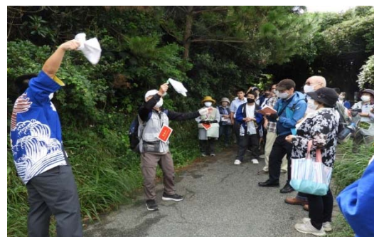
アサギマダラを呼ぶ手ぬぐい回しの実演（古山遊歩道で）