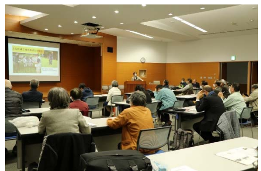
自然の魅力発見ツアーガイド体験事業の成果発表（田原市役所で）